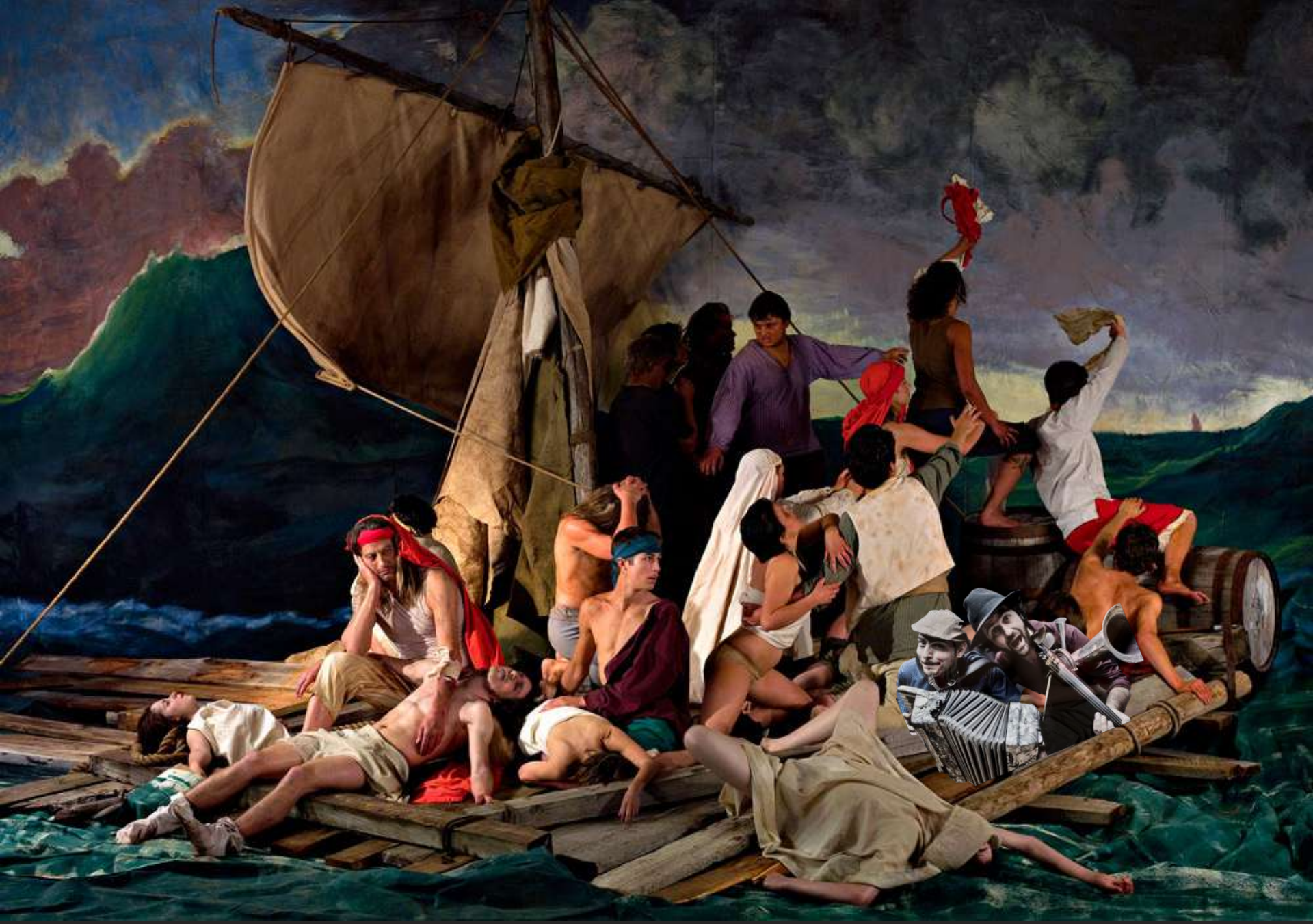
Gericault: La balsa de la Medusa (1818)